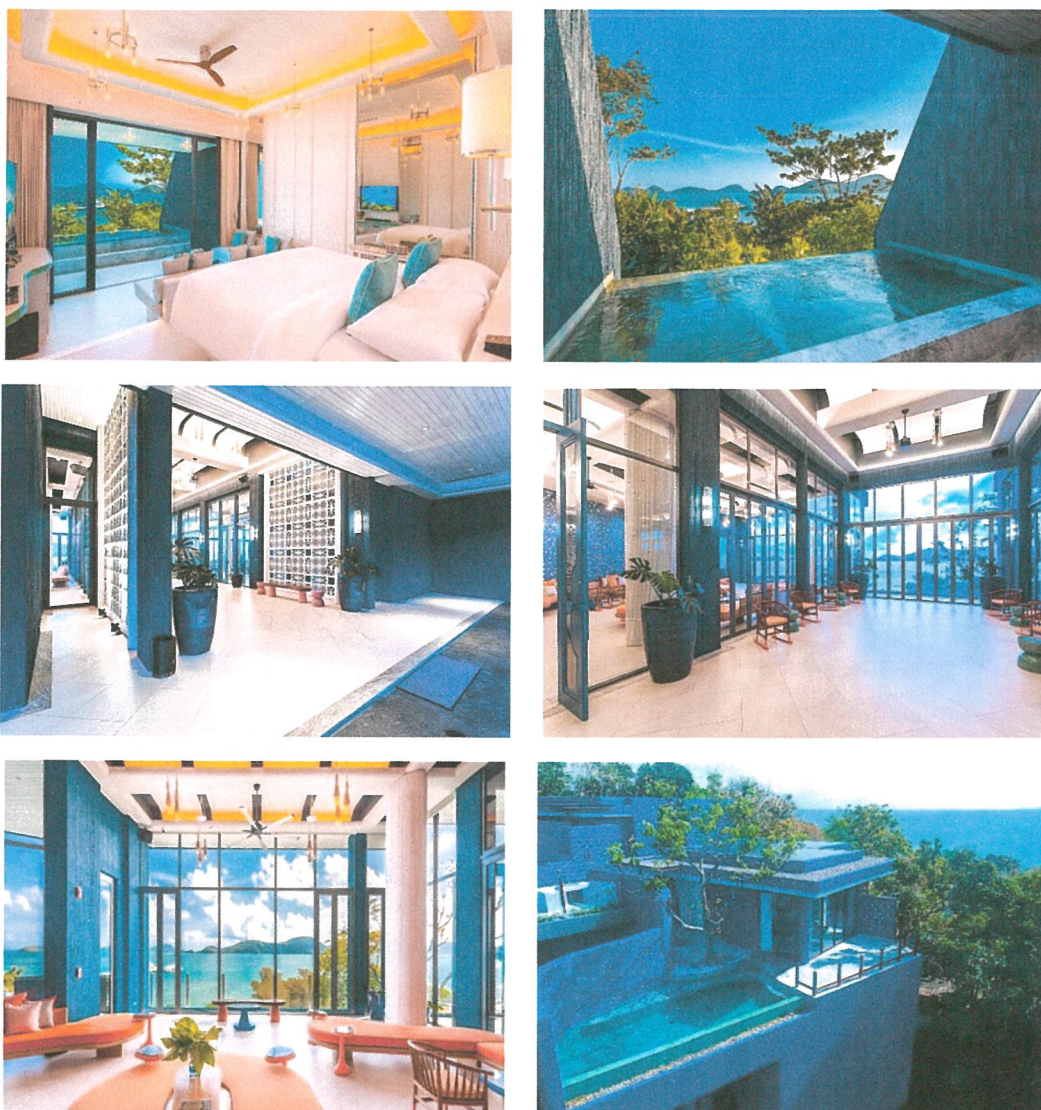
รูปภาพที่ 1.3 การใช้พื้นที่ของโครงการ